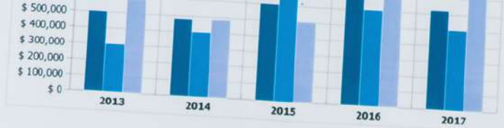
SALES COMPARISON - QUANTITY