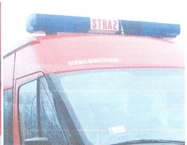
Fot. 12. Sygnalizacja świetlno-dźwiękowa.

Pojazd posiada aktualne badania techniczne ważne do dnia 14.12.2025 roku. Samochód do użytku cywilnego musi przejść badanie techniczne po zmianach konstrukcyjnych, usuwające atrybuty pojazdu specjalnego pożarniczego.