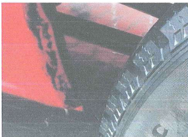
Fot. 7. Korozja nadkola lewy tył.

NADWOZIE – Pojazd posiada nadwozie kolorystycznie zgodne z warunkami technicznymi pojazdów straży pożarnej zawartych w Dz. Ust. poz. 502 z 2024 roku. Na nadwoziu znajdują się zarysowania oraz ogniska korozji.