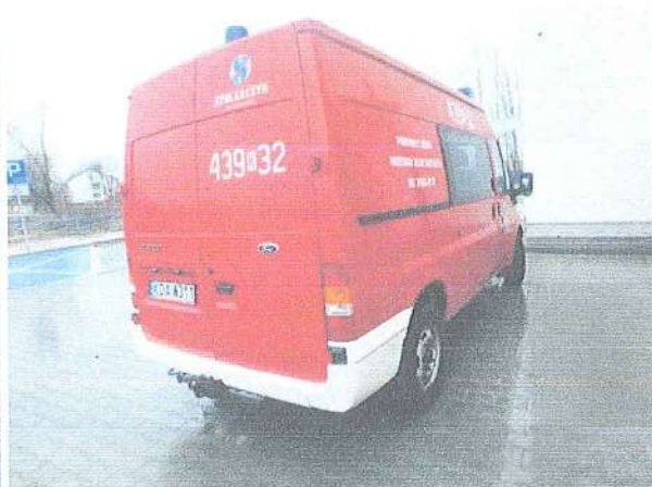
Fot. 2. Widok prawy bok pojazdu.