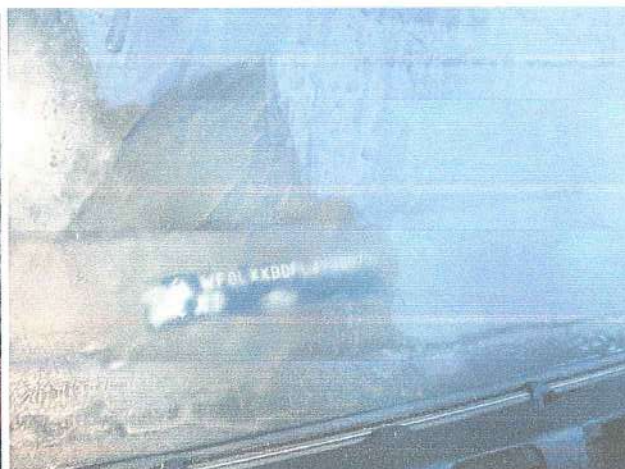
Fot. 4. Nr VIN.

SILNIK – 4 cylindrowy, rzędowy silnik wysokoprężny o pojemności 2402 cm 3 i mocy 66 kW. Pracuje prawidłowo.