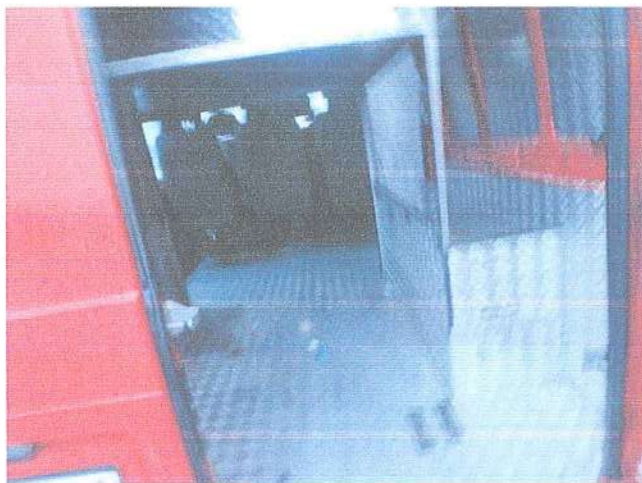
Fot. 11. Przestrzeń ładunkowa.