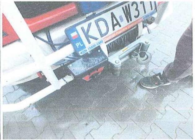
Fot. 10. Wyciągarka.