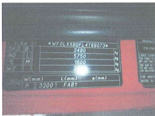
Fot. 3. Tabliczka znamionowa.