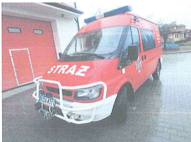
Fot. 1. Widok przód pojazdu.

Do opinii przedstawiono samochód specjalny pożarniczy marki FORD TRANSIT, użytkowany od 2004 roku w OSP Radgoszcz. Pojazd powstał na bazie samochodu ciężarowego.