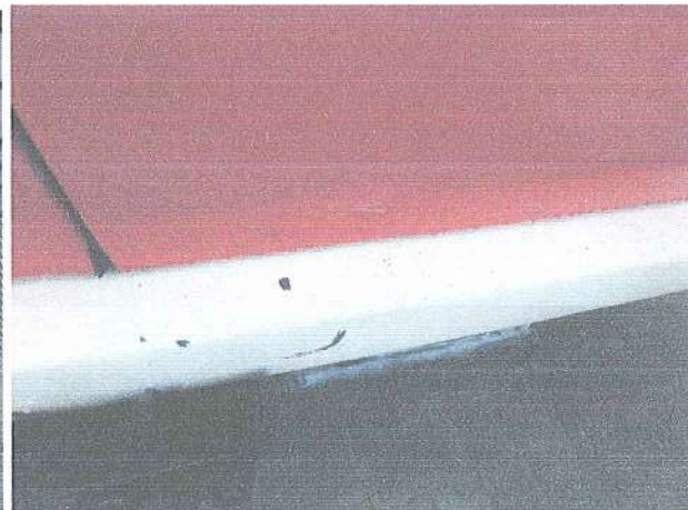
Fot. 8 . Zarysowania zderzaka tylnego.

WYPOSAŻENIE - Pojazd posiada sygnalizację świetlno-dźwiękową pojazdu uprzywilejowanego. Wewnątrz pojazd znajduje się 6 miejsc siedzących oraz przestrzeń do przewozu przenośnej motopompy wraz z osprzętem.