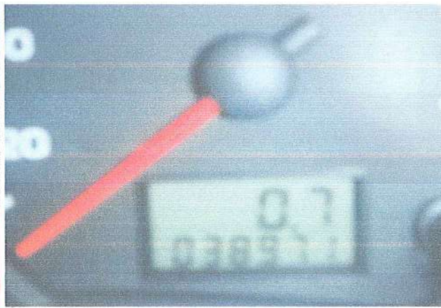
Fot. 6. Wskazanie drogomierza.

UKŁAD NAPEĐOWY – Skrzynia manualna, nieprawidłowa praca koła dwumasowego, należy je wymienić .