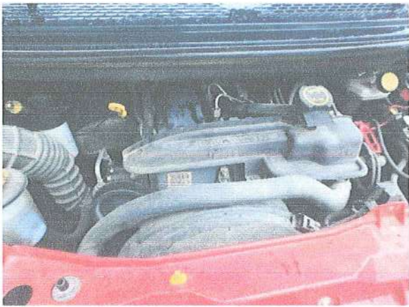
Fot. 5. Silnik.