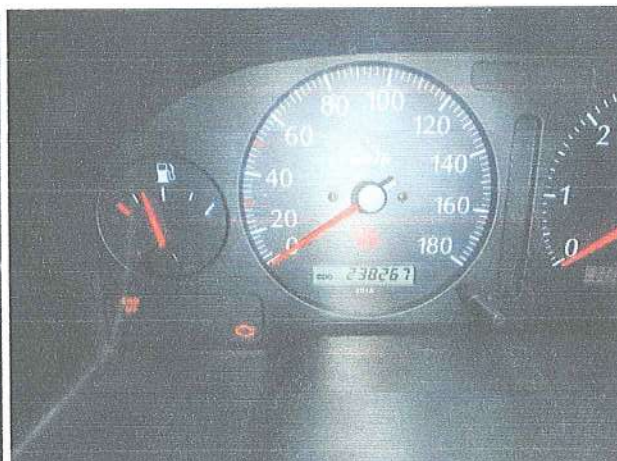
Fot. 4. Wskazanie drogomierza.

SILNIK – 4 cylindrowy, rzędowy silnik wysokoprężny o pojemności 2953 cm 3 i mocy 166 kW.