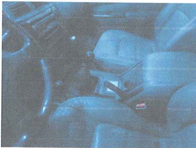
Fot. 11. Wnętrze pojazdu.

WYPOSAŻENIE - Pojazd posiada sygnalizację świetlno-dźwiękową pojazdu uprzywilejowanego. Wewnątrz pojazd znajduje się 7 miejsc siedzących. Wyposażenie znajdujące się w pojeździe należy zweryfikować po uruchomieniu pojazdu.