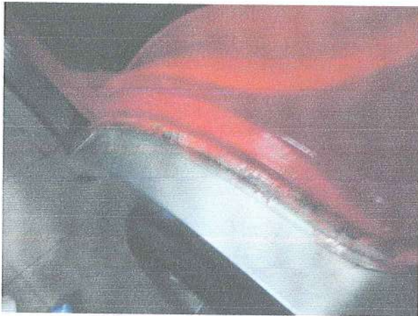
Fot. 9. Korozja nadkola lewy tył.