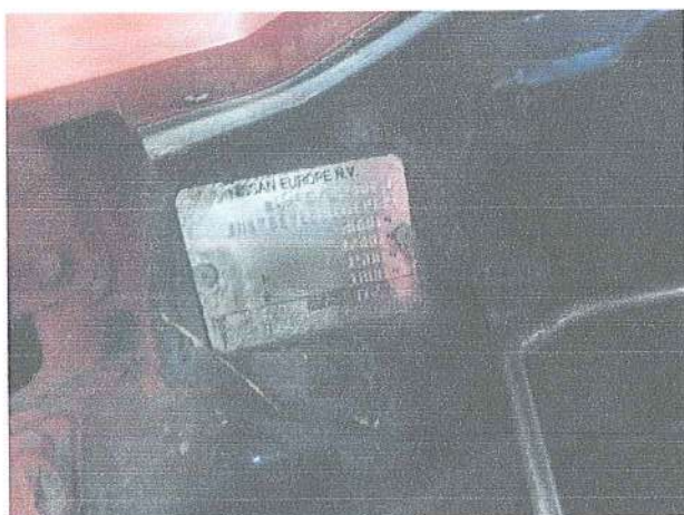
Fot. 3. Tabliczka znamionowa.