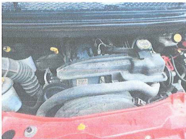
Fot. 5. Silnik.