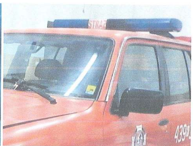
Fot. 12. Sygnalizacja świetlno-dźwiękowa.

Pojazd posiada aktualne badania techniczne ważne do dnia 06.03.2025 roku. Samochód do użytku cywilnego musi przejść badanie techniczne po zmianach konstrukcyjnych, usuwające atrybuty pojazdu uprzywilejowanego.