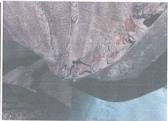
Fot. 10 . Korozja progów.

WYPOSAŻENIE - Pojazd posiada sygnalizację świetlno-dźwiękową pojazdu uprzywilejowanego. Wewnątrz pojazd znajduje się 7 miejsc siedzących. Wyposażenie znajdujące się w pojeździe należy zweryfikować po uruchomieniu pojazdu.