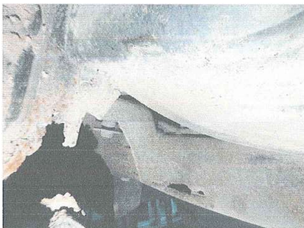
Fot. 7. Korozja ramy.

PODWOZIE – Zawieszenie oraz układ kierowniczy sprawne, wyeksploatowane adekwatnie do posiadanego przebiegu. Skorodowana rama pojazdu, poprzeczki boczne z ubytkami korozyjnymi materiału. Ramę należy poddać gruntownemu remontowi. Silna korozja tarcz hamulcowych kwalifikuje je do wymiany. Opony kół przednich i tylnych wyeksploatowane w 70%.