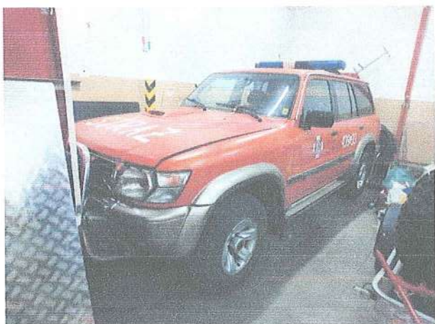
Fot. 1. Widok przód pojazdu.

Do opinii przedstawiono samochód specjalny pożarniczy marki NISSAN PATROL, użytkowany od 2015 roku w OSP Radgoszcz.