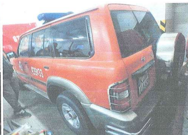
Fot. 2. Widok prawy bok pojazdu.