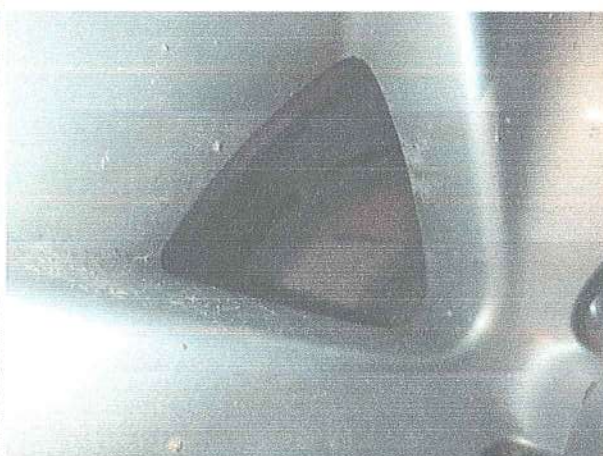
Fot. 8. Korozja tarcz hamulcowych.

NADWOZIE – Pojazd posiada nadwozie kolorystycznie zgodne z warunkami technicznymi pojazdów straży pożarnej zawartych w Dz. Ust. poz. 502 z 2024 roku. Na nadwoziu znajdują się zarysowania oraz silne ogniska korozji, progów oraz nadkoli, nadwozie należy poddać naprawie blacharsko lakierniczej.